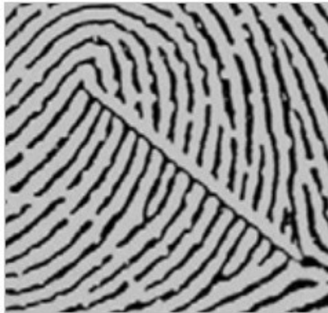
Figura 2. Trazo de la línea de Galton en una presilla (L).

En el conteo de las crestas papilares por la línea de Galton, se adoptó el método de Vucetich; es decir, se establece la cantidad de líneas existentes en el dactilograma que están atravesadas por la línea de Galton, sin tener en cuenta el punto de partida (punto déltico) y el punto de llegada (punto nuclear), de acuerdo a como lo referencian Cummins & Midlo (1961) y Zary et al., (2010).